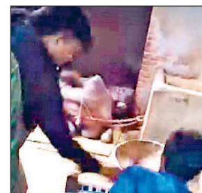
गन्नीर। नाबालिक के साथ मारपीट करते हुए।