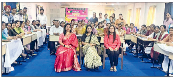
गन्नीर। कार्यक्रम में रौनक पब्लिक स्कूल में भाग लेते स्कूल के शिक्षक।

गोहाना। समाज कल्याण संगठन द्वारा रिविवार को शहर में जॉद मार्ग पर पार्क के साथ शिवमुक्ति धाम में पौधरोपण किया। पौधरोपण साप्ताहिक अभियान के तहत किया गया जिसमें संगठन के सदस्यों ने बरगद, जामुन और पालमखीरा के 28 पौधे रोपे। संगठन के सदस्यों ने नवरोपित पौधों की पशुओं से सुरक्षा के लिए उनको ट्री गाडों में संरक्षित किया। संगठन द्वारा गोहाना को ग्रीन सिटी बनाने के लिए करीब डेढ़ दशक पहले गोद लिया था। संगठन रिविवार को सार्वजनिक स्थलों और फुटपाथ की खाली जगह में पौधे रोपे।