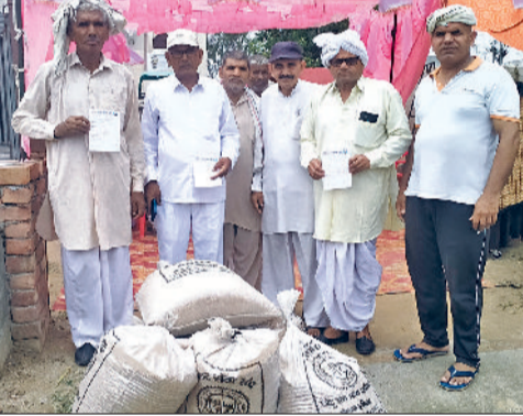
गोहाणा। धाम के लिए गेहूँ दान में करते हुए परिवार के सदस्य।